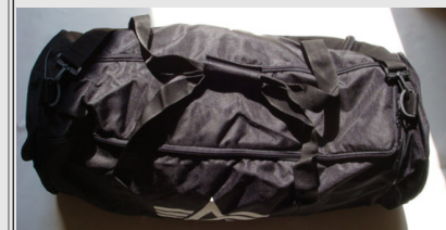
Borsone Militare Alpha Industries